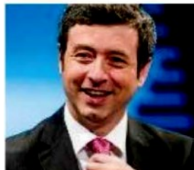
NITROSI ■ A pagina 4

Orlando: «Premio soft per la lista che vince»